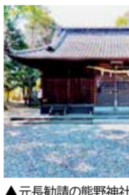
▲元長勸請の熊野神社