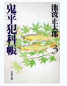
「鬼平犯科帳」(3) 池波正太郎著 文藝春秋

基本的に江戸で活躍する鬼平犯科帳では、志太の地が登場するのは、三作です。『盗法秘伝』では、岡部の宿が登場します。「平蔵は、岡部の宿の旅籠(鳥や藤兵衛)方へ旅装をといた。・・・岡部は、宇津谷峠を下ってすぐの山間の宿場で、町は〔上岡部〕と〔下岡部〕にわかれてい、鳥やが宿場のはずれに近い岡部の、小さな旅籠だ」(p51 盗法秘伝) また、『駿州・宇津谷峠』という作品があり、ここでは、岡部と藤枝が登場します。「藤枝は、駿河・田中四万石、本多家の城下町つづきの宿場で、町も大きい」(p248 駿州・宇津谷峠) 「藤枝から一里二十九丁で、岡部へ入る。岡部は山間の宿場で、ここから先が、宇津谷峠にかかる」「平蔵たちは、岡部の旅籠〔吉見屋〕へ旅装を解いた」(p250 駿州・宇津谷峠) 「右へ行くと宇津谷峠への東海道へ合するが、左へ行くと山道になって、これが桂島から朝比奈の山村へ通じてはるのた」(p255 駿州・宇津谷峠) 「ばかをいってはいけねえ。今度の盗人宿は、おれのほかには藤枝の久蔵が知っているだけだ」(p257 駿州・宇津谷峠) 「長谷川平蔵が、岸井左馬助・木村忠吾と共に、駿河の宇津谷峠を越えた…」(p266 むかしの男)