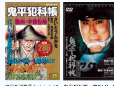
鬼平犯科帳 さいとうたかを 鬼平犯科帳 第5シリーズ 発売販売元・松竹 リイド社 ©1994松竹株式会社

1969年、鬼平犯科帳は、テレビ化され、池波正太郎の指名により、初代鬼平は歌舞伎役者の松本幸四郎(後の松本白鶴)が演じました。1975年に丹波哲郎、1980年には、萬屋錦之助、そして四代目鬼平として、池波正太郎が数年越しで口説いた中村吉右衛門が1989年、登場。1995年、中村吉右衛門主演で映画化され、今回の映画では、十代目松本幸四郎が演じています。また、松本幸四郎の長男・市川染五郎が、若き日の鬼平役を演じていて、親子共演もこの映画の見所の一つです。 また、漫画では、さいとう・たかをが1993年から連載を開始。さいとう・たかを氏逝去後も、連載が続けられています。