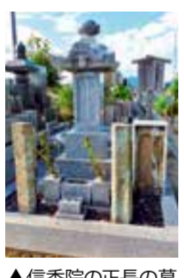
▲信香院の正長の墓