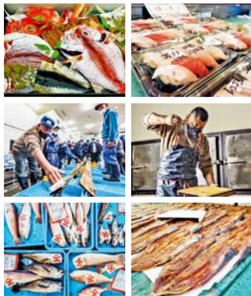
サスエ前田魚店 焼津市西小川14-15-7 054-626-0003