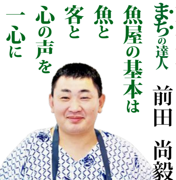
サスエ前田魚店五代目

魚屋の仕事は魚に最高のものをしをする事です。快適な温度に冷やしスピーディにさばき空気に触れさせないそれだけです。記憶に残る魚を提供し人を喜ばせるのが仕事です