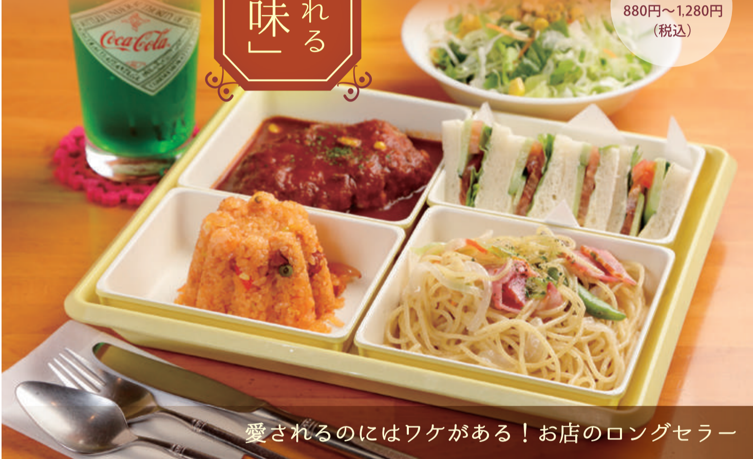
愛されるのにはワケがある! お店のロングセラー