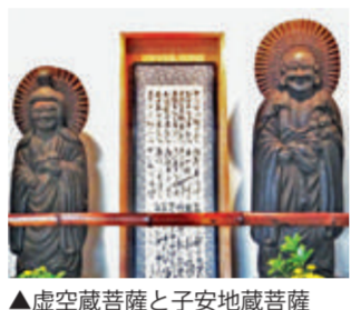
▲虚空蔵菩薩と子安地藏菩薩