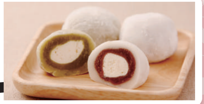
生クリーム大福 130円(税込)

焼津市西小川3-1-3 054-628-3542 9:00~19:30 木曜日 3台